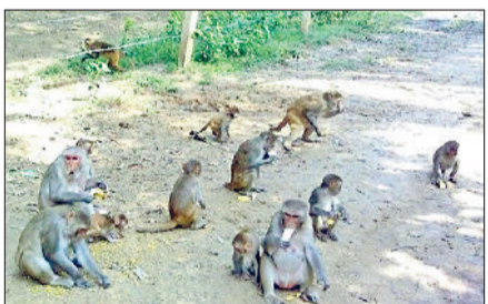
बहादुरगढ़। शहर में सार्वजनिक स्थानों पर एकत्र बंदरों के झुंड।