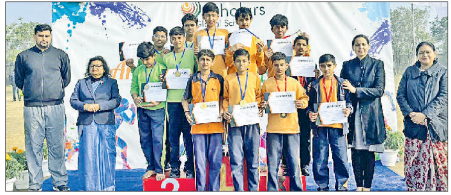
बहादुरगढ़। विजेता खिलाड़ियों को पुरस्कृत करती स्कूल निदेशिका व प्रिंसिपल।