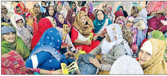
बहादुरगढ़। मंगलवार को डाबोदा गांव में जोहड़ पर कीर्तन करती महिलाएं।

मेहंदीपुर डाबोदा गांव में श्रद्धा और भक्ति के वातावरण के बीच दादा जोहड़ वाले पर मंगलवार को कीर्तन एवं भंडारे का भव्य आयोजन किया गया। कार्यक्रम में आसपास के गांवों से बड़ी संख्या में श्रद्धालु पहुंचे और दादा जोहड़ वाले के चरणों में हाजिरी लगाकर सुख-समृद्धि की कामना की। कीर्तन के दौरान भजन मंडलियों ने एक से बढ़कर एक भजन प्रस्तुत किए, जिनसे पूरा माहौल भक्तिमय हो गया। श्रद्धालु दोपहर तक कीर्तन में लीन रहे और भजनों के माध्यम से दादा की महिमा का गुणगान किया गया। आयोजन के बाद भंडारे का प्रसाद वितरित किया गया, जिसमें सभी वर्गों के लोगों ने