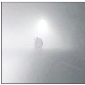
कारण वाहन चालकों और स्थानीय निवासियों ने संबंधित इकाई से मामले में सुध लाने हुए इन बेसहारा गोवंशों को गोशालाओं में भेजने की

आमजन की दिनचर्या प्रभावित रही और वाहन चालकों को अपने गंतव्य तक पहुंचने में काफी परेशानी हुई। सबसे अधिक परेशानी नौकरी पेशा लोगों और स्कूल कॉलेज जाने वाले विद्यार्थियों को हुई। जिन्हें अपने संस्थानों में निर्धारित समय से बाद में पहुंचने का अधिकतम तापमान 19 डिग्री सेल्सियस और न्यूनतम तापमान सात डिग्री सेल्सियस दर्ज किया गया। विशेषज्ञ आगामी दिनों में तापमान में और अधिक गिरावट दर्ज करने का अनुमान लगा रहे हैं।