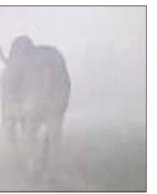
झंझर। घने कोहरे में सड़कों के बीचों बीच खड़े बेसहारा गोवंश।

घने कोहरे के कारण जहां वाहन चालकों को अपने गंतव्य तक पहुंचाने में काफी दिक्कतें हो रही हैं, वहीं सड़कों पर खड़े बेसहारा गोवंशों ने वाहन चालकों की परेशानियों को और अधिक बढ़ा दिया है। गलियों, चौक चौराहों व हाईवे पर बेसहारा गोवंशों का जमावड़ा लगा रहता है। घने कोहरे के कारण ये बेसहारा गोवंश दिखाई नहीं देते। जिसके कारण दुर्घटना होने का खतरा मंडरा रहा है। कई दफा हादसे होते भी बचे हैं। जिसके