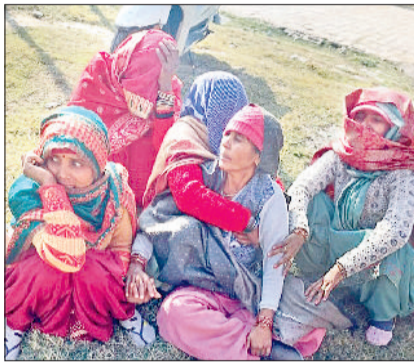
लेंकर पहुंचे। यहां चिकित्सकों ने उसे मृत घोषित कर दिया। इसके उपरांत पुलिस ने परिजनों से मामले की जानकारी लेते हुए शव को पोस्टमार्टम के लिए अस्पताल के शवगृह भिजवाया। बाद में मृतका के मायका पक्ष के लोग पहुंचने के बाद उनकी मांग पर चिकित्सकीय बोर्ड से पोस्टमार्टम कराया गया।