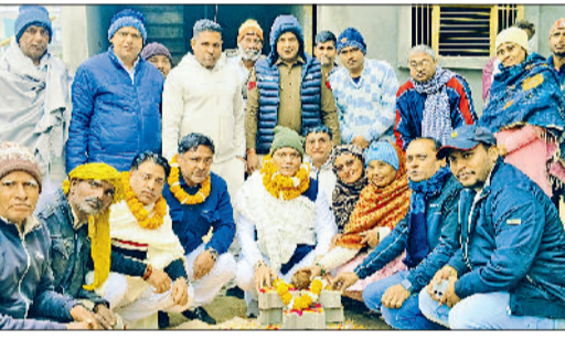
बहादुरगढ़। नारियल फोड़कर गली निर्माण कार्य का शुभारंभ करते विधायक राजेश जून।

इस गली के निर्माण कार्य का शुभारंभ कर दिया है। विधायक ने